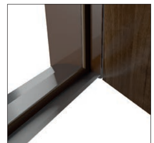
wysokiej jakości próg ze stali nierdzewnej o wartości 75 pln w komplecie z ościeżnicą metalową gratis