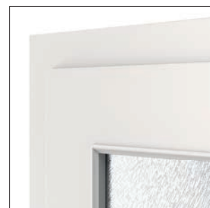
klasyczny profil ramki