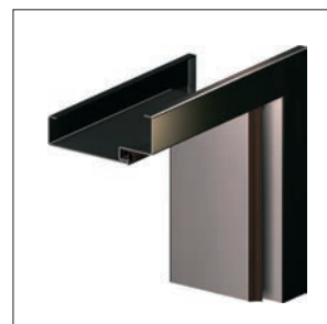
ościeżnica metalowa kątowna